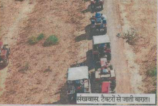
संखवास, टैक्टरों से जाती बारात।